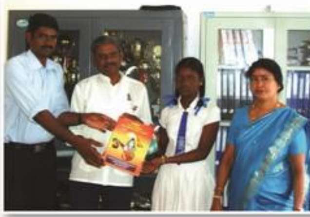
சுவிஸ் காரை அபிவிருத்திச் சபையின் அனுசரணையுடன் சங்கீதபாட நூல் வெளியீடு