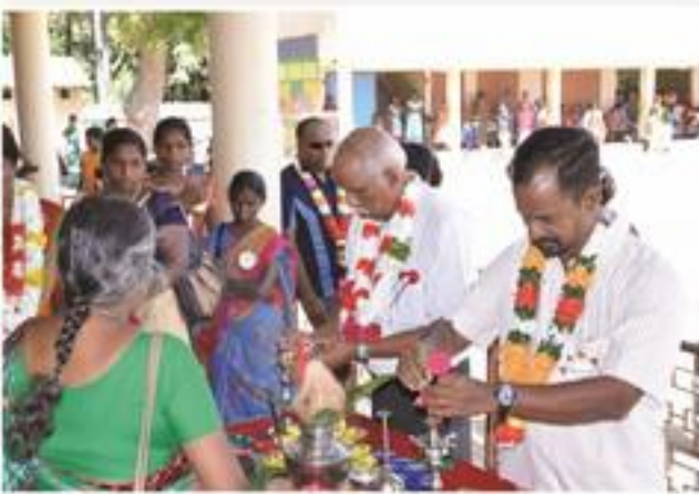
சபையின் அனுசரணையுடனான பிரதேச மட்ட முன்பள்ளி விளையாட்டுப்போட்டியில்