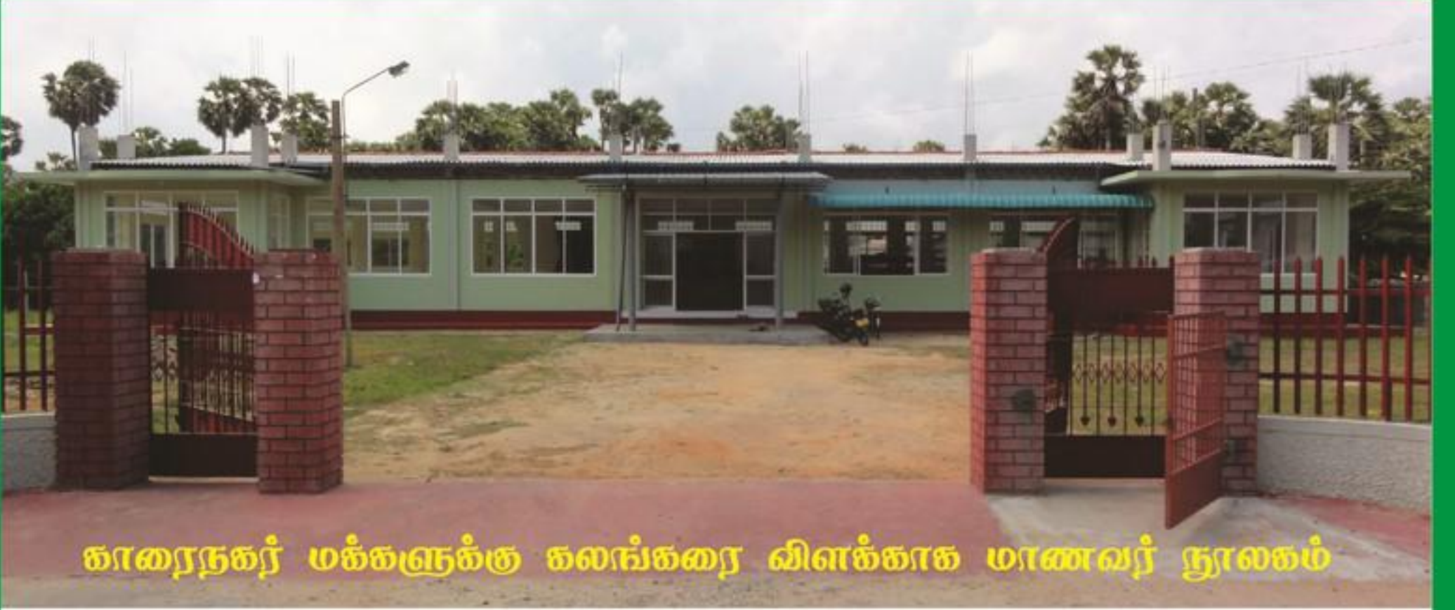
காரைநகர் மக்களுக்கு கலங்கரை விளக்காக மாணவர் நூலகம்