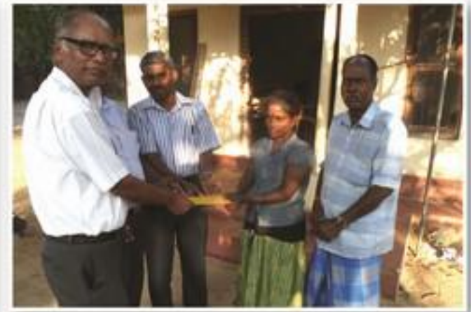
இருதய சத்திரசிகிச்சைக்கான நிதியுதவி