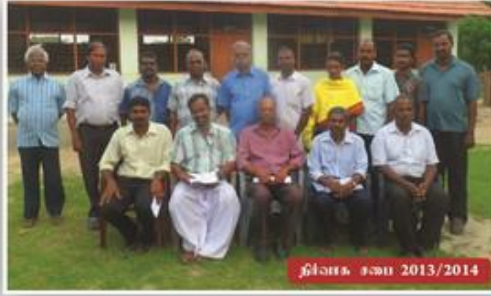
தினா சபை 2013/2014