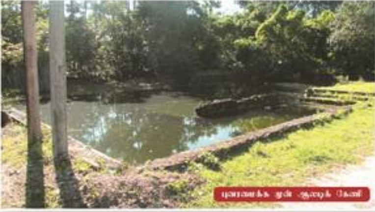
மாணவர் நூலகம் - ஆறுநகர் கிளை