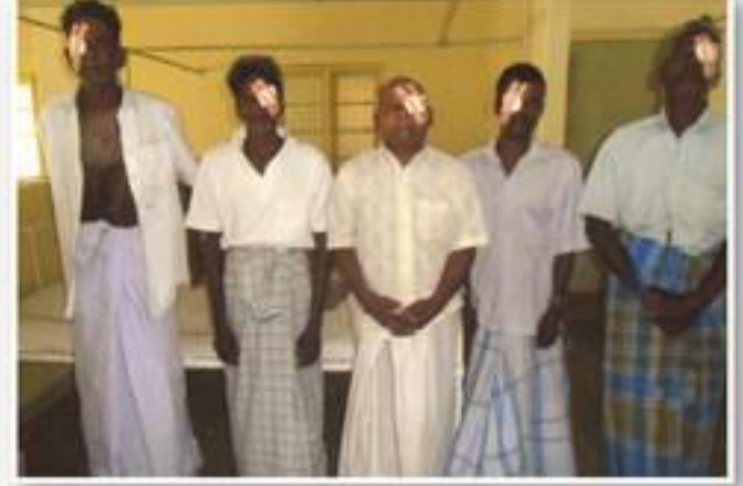
பிரித்தானிய காரை நலன்புரிச் சங்கத்தின் நிதியுதவியுடன் இடம்பெற்ற விழிவெண்படல சத்திரசிகிச்சையின் போது