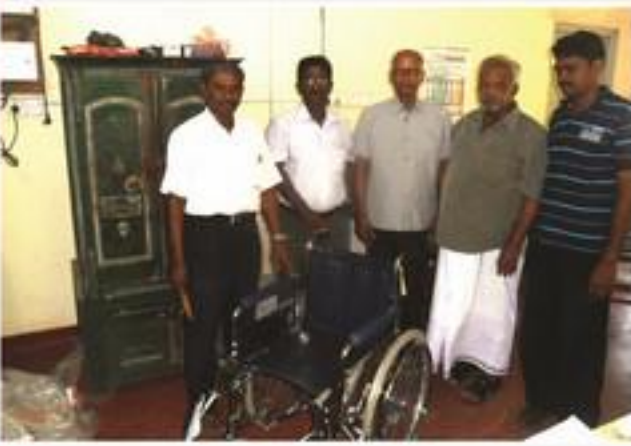
மூளாய் கூட்டுறவு வைத்தியசாலைக்கு சக்கரநாற்காலி அன்பளிப்பு