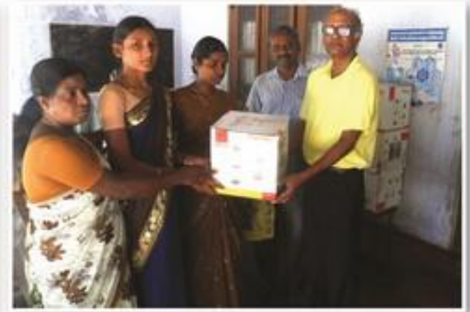
முன்பள்ளிகளுக்கான குக்கர் கையளிப்பு