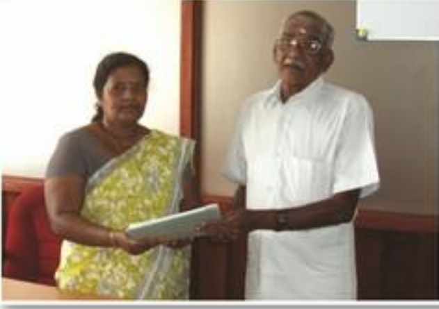
ஆயுள்வேத வைத்தியசாலைக்கான காணி கையளிப்பு