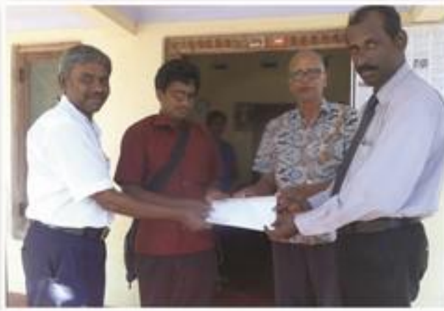
விழிப்புலனற்ற ஐங்கரனுக்கு வாழ்வாதார உதவி