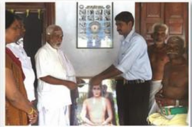
களபூமி ஆரணியத்திற்கு நிதி கையளிப்பு